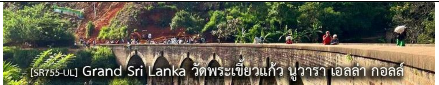
[SR755-UL] Grand Sri Lanka วัดพระเขี้ยวแก้ว นูวารา เอลล่า กอลล์

[SR755-UL] Grand Sri Lanka อนุราช โปโลนนารูวะ ถ้ำดัมบูลล่า วัดพระเขี้ยวแก้ว สิททียา พระราชวังลอยฟ้า เมืองแคนดี้ เมืองนูวารา เมืองเอลล่า กอลล์ โคลัมโบ