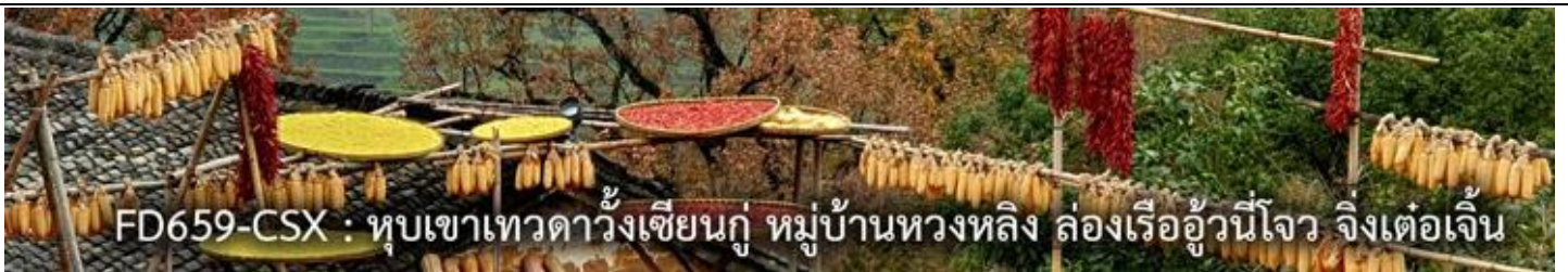
FD659-CSX : หุบเขาเทวดาวังเซียนกู่ หมู่บ้านหวงหลิง ล่องเรืออู๋นี่โจว จิ้งเต๋อเจิ้น

(FD659-CSX) : หุบเขาเทวดาวังเซียนกู่ หมู่บ้านโบราณหวงหลิง ล่องเรือชมแสงสีอู๋นี่โจว ภูเขาหลิงซาน ไหว้พระใหญ่ตงหลิน เมืองจิ้งเต๋อเจิ้น พิพิธภัณฑสถานเซรามิก (พักหุบเขาเทวดา)