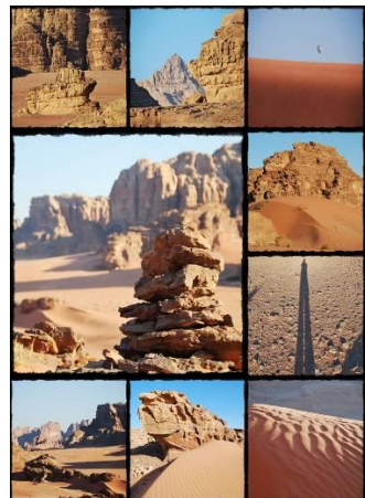
มา การ ขาน เสียง

กลางวัน ๑๐) รับประทานอาหารกลางวันบาบิโลว์ บนเรือ พร้อมชมทัศนียภาพ และบรรยากาศของทะเลแดง บ่าย นำท่านเดินทางสู่ ทะเลทรายวาดีรัม (WADI RUM) ทะเลทรายแห่งนี้ในอดีตเป็นเส้นทางคาราวานจากประเทศ ซาอุดีอาระเบีย เดินทางไปยังประเทศซีเรียและปาเลสไตน์ (เคยเป็นที่อยู่อาศัยของชาวนาบาเทียนก่อนที่จะย้ายถิ่นฐานไป สร้างอาณาจักรอันยิ่งใหญ่ที่เมืองเพดร้า) ในศึกสงครามอาหรับรีโวลท์ระหว่างปี ค.ศ. 1916–1918 ทะเลทราย แห่งนี้ได้ถูกใช้เป็นฐานบัญชาการในการรบของนายทหารชาวอังกฤษ ทีอี ลอว์เรนซ์ และ เจ้าชายไฟซาล ผู้นำแห่ง ชาวอาหรับร่วมรบกันขับไล่พวกออตโตมันที่เข้ารุกรานเพื่อครอบครองดินแดน และต่อมายังได้ถูกใช้เป็น สถานที่จริงในถ่ายทำภาพยนตร์ฮอลลีวูดอันยิ่งใหญ่ในอดีตเรื่อง “LAWRENCE OF ARABIA” นำท่านนั่งรถกระบะเปิดหลังมารับบรรยากาศท้องทะเลทรายที่ถูกกล่าวหาว่าสวยงามที่สุดแห่งหนึ่งของโลก ด้วยเม็ดทรายละเอียดสีส้มอมแดงอันสงบที่กว้างใหญ่ไพศาล (สีของเม็ดทรายนั้นปรับเปลี่ยนไปตามแสงของ ดวงอาทิตย์) นำท่านท่องเที่ยวทะเลทรายต่อไปยังภูเขาคาซารี ชมภาพเขียนแกะสลักก่อนประวัติศาสตร์ ที่เป็นภาพแกะสลักของชาวนาบาเทียนที่แสดงถึงเรื่องราวในชีวิตประจำวันต่างๆ และรูปภาพต่าง ๆ ผ่านชมเดินที่ชาวเบดูอินที่อาศัยอยู่ในทะเลทราย เลี้ยงแพะเป็นอาชีพ ฯลฯ (เป็นธรรมเนียมปฏิบัติในการให้ทิปท่านละ 2 USD แก่คนขับรถ)